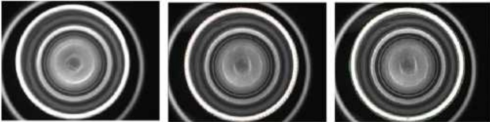
Empty cans image processing process

????????????????? ?????????????????? ? ??????????????????????