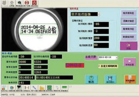
Inspection system interface