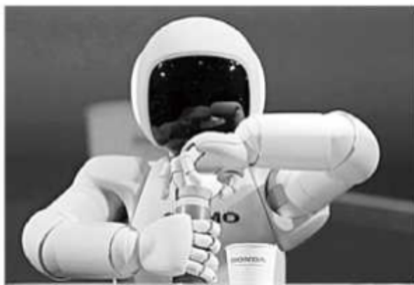
Robot drink drinks