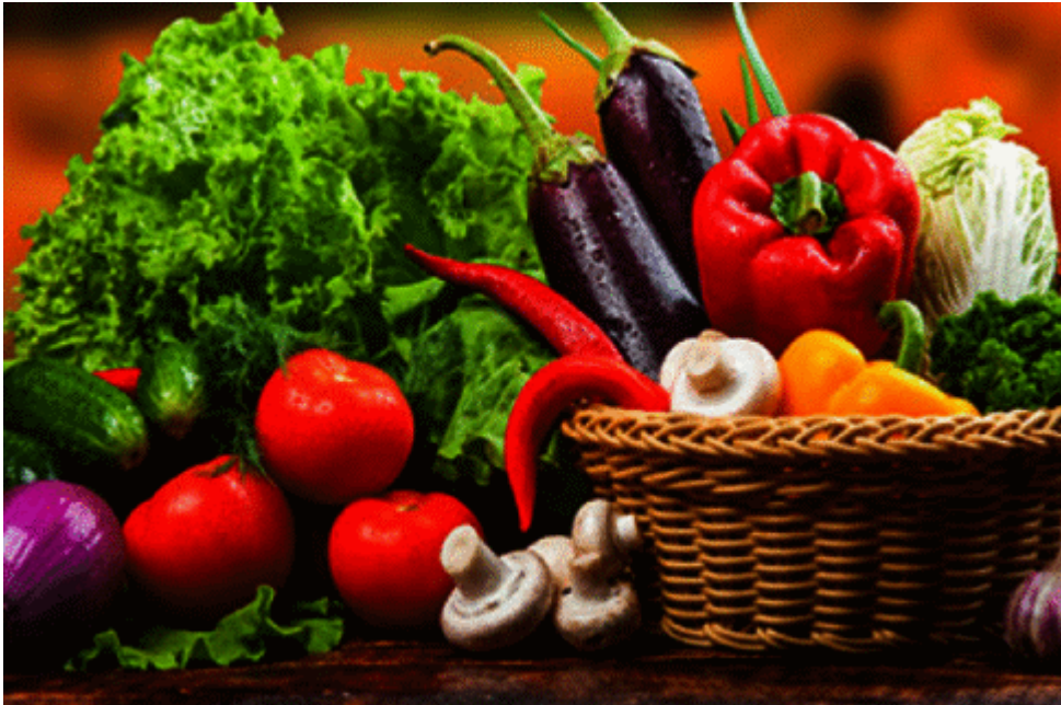
?????? ??????? ?????????????? ???????

3. ??????? ??????????, ??????? ???????, ??????? ?????????? ???????, ??????? ??????????? ????????? ??????? ?????? ??????????? 12 ?/??? ?? ??????? ?????????? ?????? ??????? ?????????? ?? ??????????? ???????!